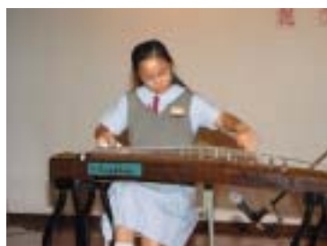
同學的技巧多純熟啊！