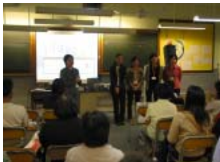
今次講座的講員份量十足！

十一月七日晚上，家教會邀請了衛生署青少年健康服務隊到校，以輕鬆活潑的手法，講解青少年的心理發展和社交特徵，並指導家長如何以正面態度配合。會上家長踴躍發問，相信他們一定獲益良多。