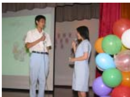
普通話相聲《重男輕女》