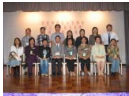
第八屆家長教師會常務委員全家福