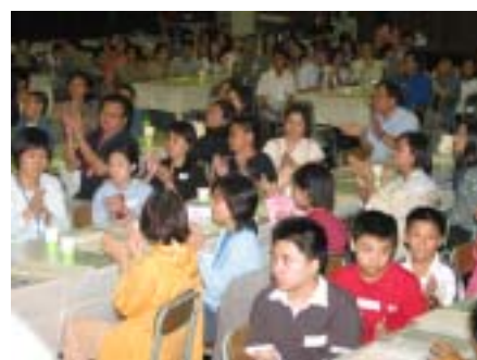
大家濟濟一堂，共渡歡樂時光！