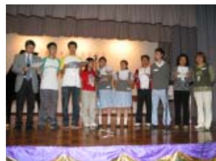
校長 老師 家長 同學來個大合唱！