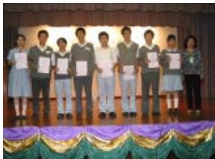
主席頒獎予閱讀獎勵計劃得獎同學

第八屆會員大會暨親子自助餐已於二零零三年十月十八日(星期六)下午六時在本校禮堂進行。該晚出席人數達二百三十多人，大家濟濟一堂，十分熱鬧。