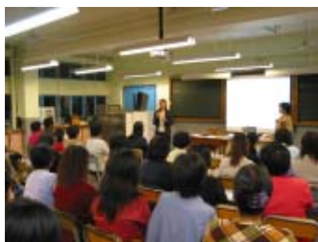
大家全神貫注地聽講座