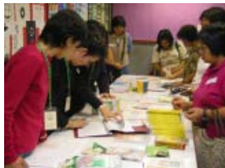
家長踴躍借閱親子書籍