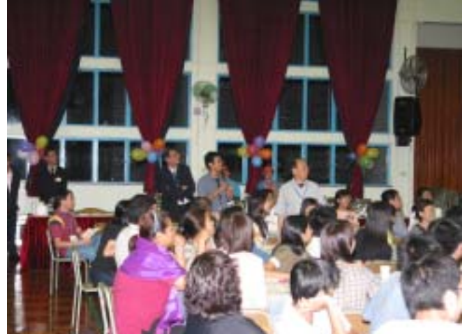
猜歌曲時，大家全情投入。