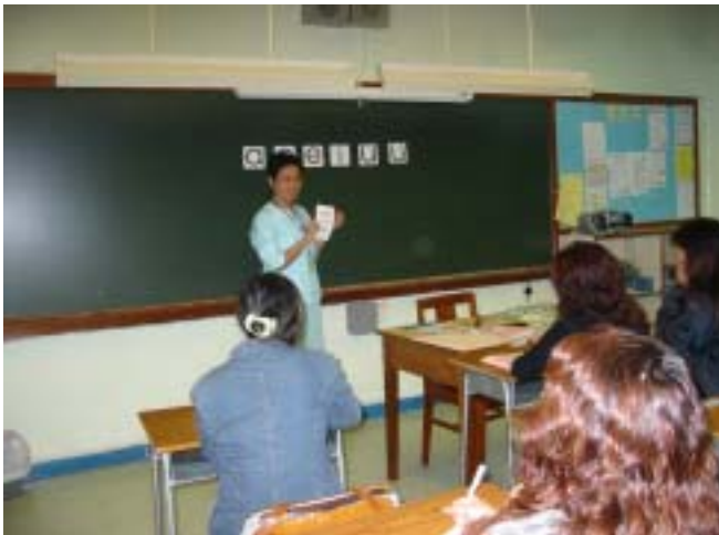
實用普通話班上課情況