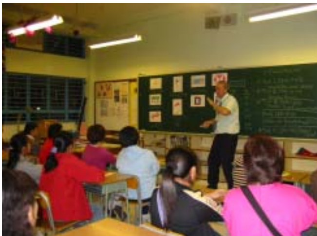
家長學生齊齊學英語