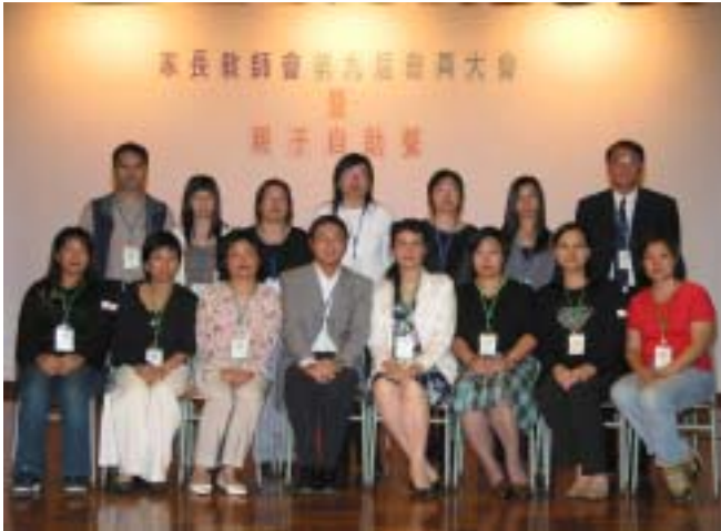
第九屆常務委員會全體合照