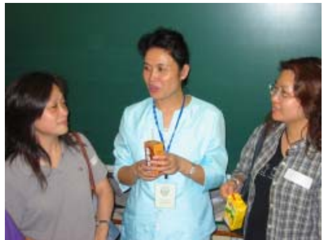
小息時間，大家分享學習心得。