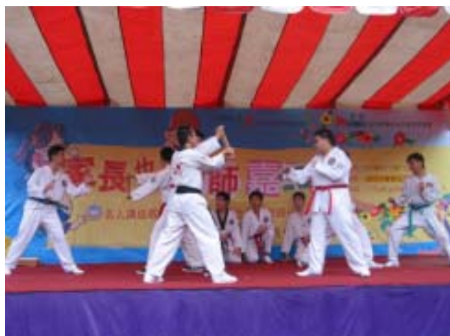
同學打起跆拳道來，勁道十足。