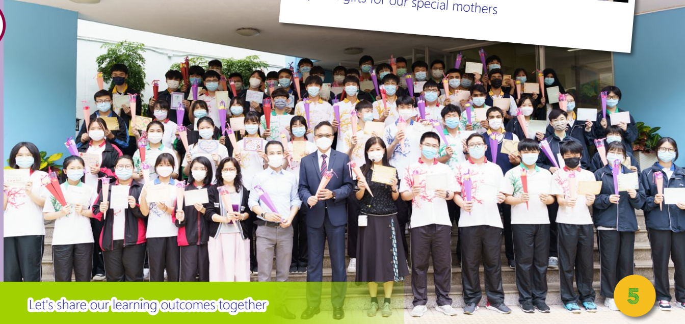
Let's share our learning outcomes together