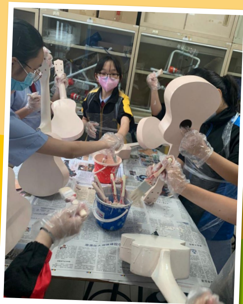
積極投入，樂在其中