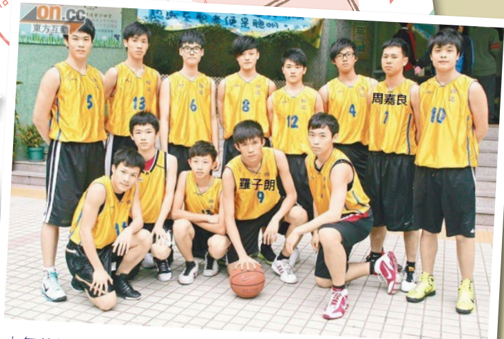
十年前的鑽石陣容