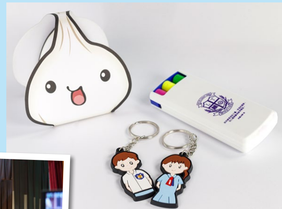
為同學傳送正能量的「打氣包」