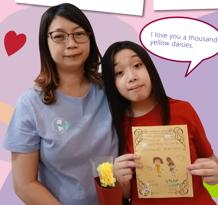
I love you a thousand yellow daisies.