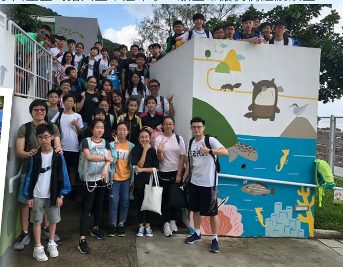
由沙田堂所舉辦的福音營活動