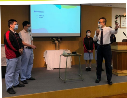
由王校長親自教授匯報技巧