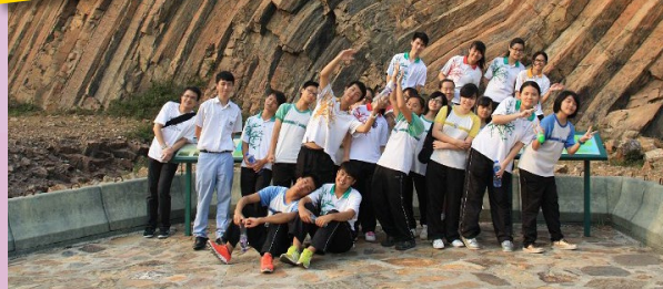
作為地理科老師，少不免要跟學生攀山涉水