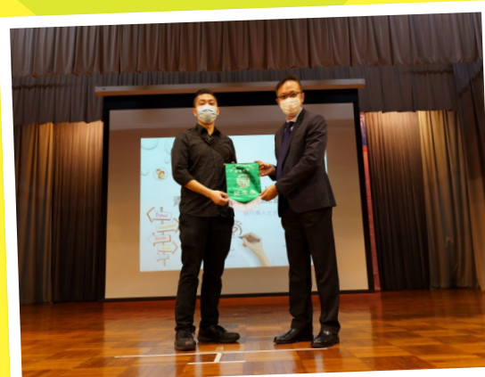
與行業人士分享講座