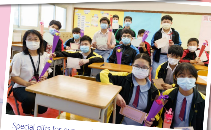
Special gifts for our special mothers