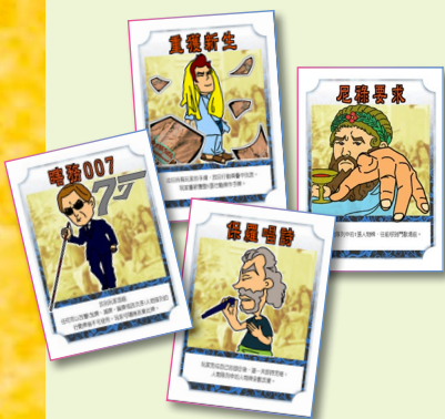
自創桌上遊戲傳福音

何傳道又借用神學院教授所寫的《信仰尋找明白》一書，解釋道：「基督信仰是相信上帝會為人預備最好的事物，而這個『最好』，必是上帝按祂的旨意所定的，而不是我們世人認為的。」又如腓立比書 4 章 13 節所言：「我靠著那加給我力量的，凡事都能做。」信仰使我們能有力量去面對世上所有事情，既可以盡情歡笑、享受富足，亦可以面對悲傷、承擔困苦。希望大家能透過樂道中學認識基督信仰，靠著主耶穌基督的力量，在戰勝生活的困苦時，亦能擁抱快樂人生！