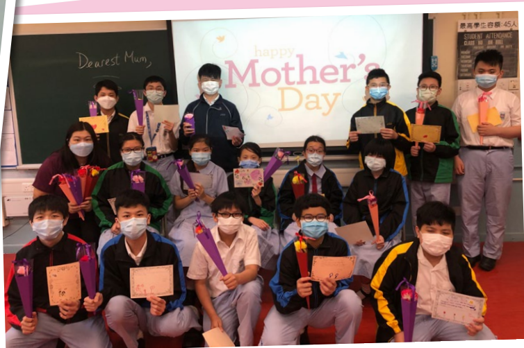
A day to let our mums know how grateful we are for their love