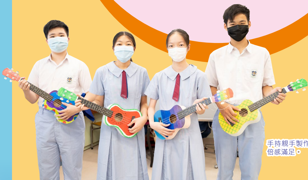
手持親手製作的樂器， 倍感滿足。

「STEAM」為教育的新趨勢，為此，樂道中學設計了一個跨科合作的新課程，當中結合了科技教育的「技」、視覺藝術科的「美」與及音樂科的「韻」，讓同學親手製作具個人特色的「Ukulele」，亦能實踐「STEAM」的理念。製作過程須要克服不同的困難，例如裝上纖幼的弦線時，講求心靜、手定；油上底油時要達致均勻；安裝配件時，不可只講力度，最重要是講求數學科的「準」。當中雖然崎嶇，但當同學能把所學到的知識，轉化為手中能彈能奏的樂器時，付出的辛勞都是值得的。