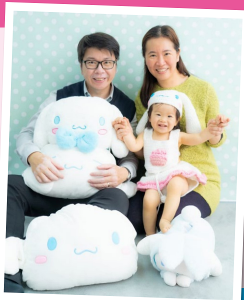
一家三口，樂也融融

我很喜歡跟年青人相處，閒時喜歡彈結他，也試過與青少年「夾 BAND」，真期待與一眾樂道中學的師生一起享受音樂，切磋一番！除了音樂外，我也喜歡桌上遊戲，在從事傳道工作前，我的專業是平面廣告設計，在機緣巧合下，我設計了一套有關聖經的遊戲咭，如果大家對聖經或桌上遊戲感興趣，歡迎到宗教室相聚！若大家想更了解基督信仰、又或在信仰上有疑問，我亦很樂意與大家一起探討，宗教室永遠會為大家開放！