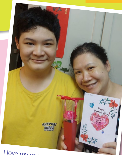
I love my mum to the moon and back