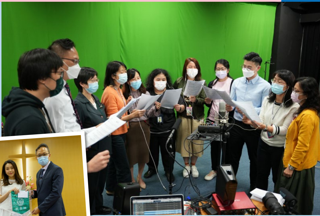
師生大合唱：《晴天雨天》

今年風浪處處，但神的慈愛與同在依舊不變；無論得時不得時，祂總是幫助我們，使我們有力量面對逆境。《聖經》說：「耶和華是我的力量，是我的盾牌，我心裏倚靠祂，就得幫助。」(詩篇 28:7) 願全校上下都能得著從神而來的祝福，見證神的奇妙作為！