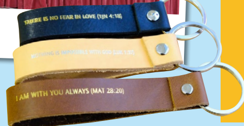
每道工序都是師生的祝福