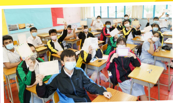
Students proudly show their thank you cards