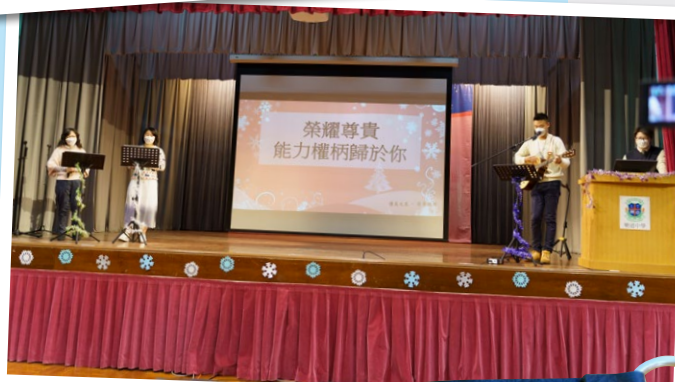
排除萬難下舉辦的聖誕崇拜