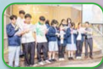
Lock Tao Good Voice - inspiring action through music