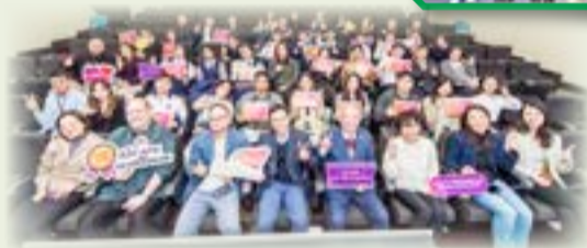
本校校園電視台獲邀出席頒獎禮。