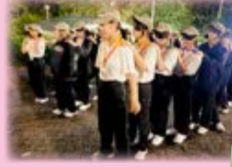
同學夜間步行，挑戰膽量。

為培育學生的自律、增強團體合作精神，並提升他們的責任感和解決問題的能力，本校訓育組特意安排學生於 2025 年 10 月 16 日至 10 月 17 日，參加兩日一夜之宿營活動。學生在過程中表現認真投入，在導師的指導下，參加了不同的戶外團體活動、歷奇活動及步操訓練，體驗課堂以外的群體生活。同學透過不同的團隊活動，學會如何與他人合作，加強了尊重和同理心，成為正向守規的樂道人。