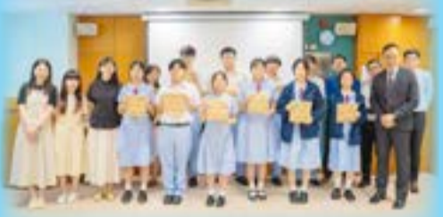
中六學生獲贈打氣包

為了鼓勵升讀中六的菁英計劃學生更積極備戰文憑試，本校學術發展組於 2025 年 7 月 9 日舉辦了「菁英計劃—文憑試備試誓師大會」。大會先由校長致詞勉勵學生，然後由小鳳姑娘祈禱祝福，本組的老師即場贈送打氣包予學生，也講解了一些升學資訊和備試策略以提醒學生為迎接文憑試作好準備。最後，老師更寫上鼓勵字句贈予學生，期望學生面對文憑試時能夠「搏盡無悔」。