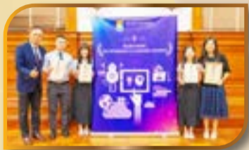
校長特前來支持獲獎老師

樂道中學積極推動電子教學的應用，致力提升學習與教學的成效。本校四位教師早前參加了由香港大學電子學習發展實驗室舉辦的「傑出電子教學獎」(2024/25) 比賽，憑藉其卓越的教案在 80 間中學及 300 位教師中脫穎而出，榮獲銀獎及優異獎，並獲邀出席 2025 年 10 月 16 日的頒獎典禮。以下是本次比賽的獲獎詳情：