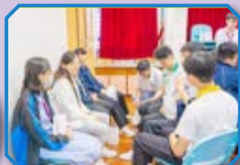
小鳳姑娘與學生一同禱告