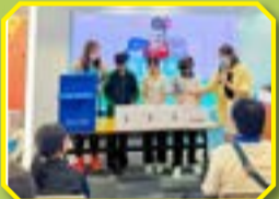
同學積極參與「選舉資訊中心」活動