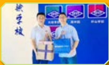
陳副校長與友校交換心意禮物