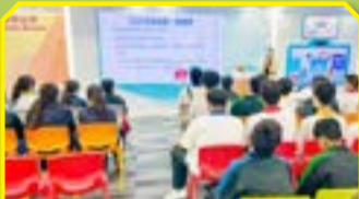
同學留心聆聽中心職員的講解