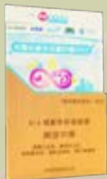
本校榮獲「AI x 健康教育推廣獎」