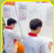
同學留心查看展版內容