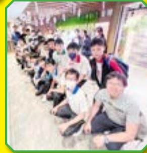
同學參觀飲食行業，表現雀躍