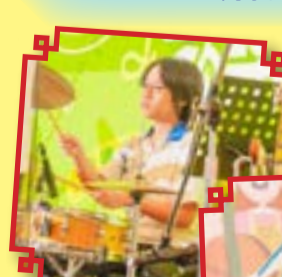
樂隊成員在舞台上自信地表演。

在演出中，本校樂隊展現了他們的音樂才華。學生在舞台上自信地表演，充分展現了他們的努力與熱情。這次演出不僅讓觀眾感受到音樂的魅力，也促進了青年人之間的聯結和交流。學生在這次活動獲益良多，他們在練習的過程中學習到堅毅和努力的精神，也在演出中提升自信，燃點了對社區和音樂的熱誠。