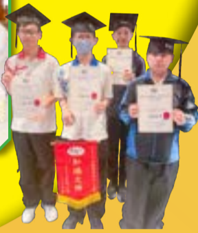
同學獲取活動證書