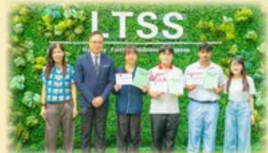
Well done to our exceptional student on this well-deserved honor!