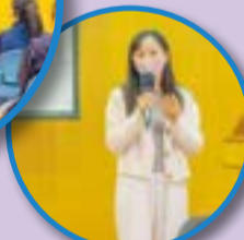
負責老師簡介計劃