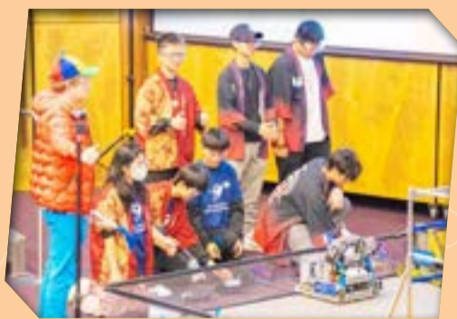
隊員認真地準備比賽。

這場盛大的賽事匯聚了來自多個亞太國家和城市的頂尖隊伍。面對來自世界各地的強勁對手，本校學生毫不膽怯，沉著應對，展現了卓越的實力，最終成功以第七名聯盟隊長的身份晉級季後賽。其後，本校資優機械人隊與香港可譽中學組成強大聯盟，他們須在短時間內與盟友磨合、分工與協調，共同應戰，同學們在過程中展現出色的溝通技巧和臨場應變能力。在與各國強隊進行的深入交流與學習中，他們深刻感受到代碼與邏輯不僅是書面理論，更需要通過無數個日夜的設計與調試，才能在實戰中展現精準的操作。他們更在壓力中成長，學習到許多新知識和了解到機械人零件模組化的重要性，並為未來的發展奠定了堅實的基礎。