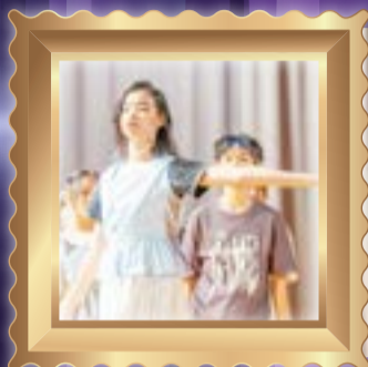
The teacher has a flare for the dramatics