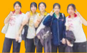
同學透過活動加深友誼

通過是次兩地的交流，讓樂道學生知道，未來的發展不只是囿於香港，大灣區前進的巨輪，是澎湃不息的，粵港兩地的年青學子分別是各自砥礪前行，合則是青春奔赴，共譜大灣區樂章，一如兩校的交流篇章。