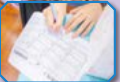
同學積極為未來籌謀