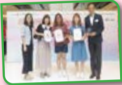
本校家教會主席及副主席獲頒「優秀家長獎」。

此外，本校舞蹈隊亦獲邀擔任表演嘉賓。同學們為此精心籌備，最終精彩的演出贏得在場觀眾的熱烈掌聲，充分展現本校學生的才華與團隊精神。