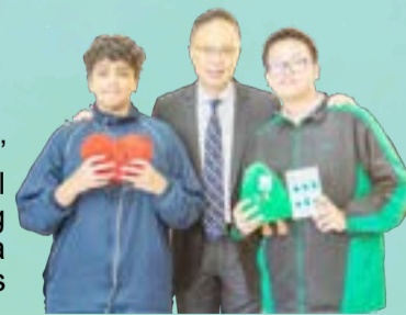
Prize Redemption - achieving six-star global citizenship

The week wrapped up with a 'Prize Redemption' event for students who earned the 'A Six-Star Global Citizen' status on their Earth Passport, celebrating their active participation. Overall, English Week was a successful initiative that promoted both English skills and awareness of environmental issues.