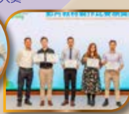
本校獲得 KS3 英文組別優異獎