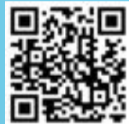
賽馬會「混合式學習」計劃 混合式學習教學實踐記錄影片