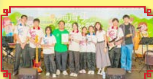
本校樂隊獲邀參加青年音樂節。

本校樂道中學的樂隊「Lock Tao Melon」於 2025 年 5 月 4 日參加了「沙田青年音樂節 2025」，表現優異，為社區貢獻。此次活動旨在透過音樂凝聚社區共識，反映社會的多樣性，並建立更緊密的社區聯繫，提升沙田的形象，讓大家一起共同講述沙田的故事。