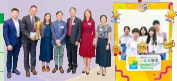
本校表現卓越，獲得評審特別嘉許 參與 KS3 數學組別比賽的師生合照