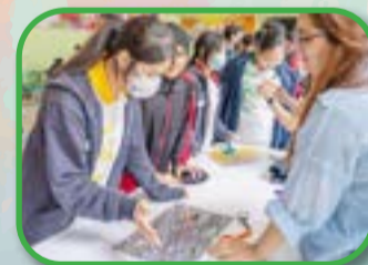
Booth Games - learning through laughter

Lunchtime was bustling at our three game booths—'Mountain', 'Ocean', and 'Sky' (MOS)—where students engaged in English-themed challenges and had the chance to win prizes.