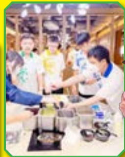
同學體驗飲食行業的工作