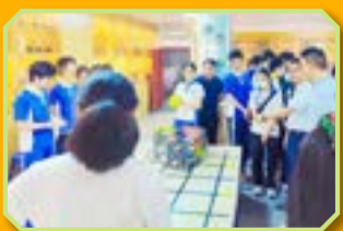
同學積極投入活動