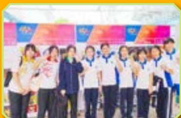
同學透過活動擴闊社交