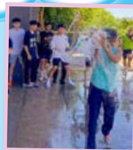
打水仗的狂歡瞬間

活動不僅提升了學生的團隊合作能力和溝通技巧，更著意塑造同學們的領導素質。同學們透過各種挑戰和訓練，有效建立了正向的生活態度，為他們的成長與發展帶來了寶貴的學習經歷。在黑夜定向環節，培養了同學勇敢堅毅的精神，更令他們學懂互相照顧及協作，最終所有人都成功完成訓練目標。期盼在王志偉校長的訓勉下，同學們能夠茁壯成長，成為社會未來的領袖。