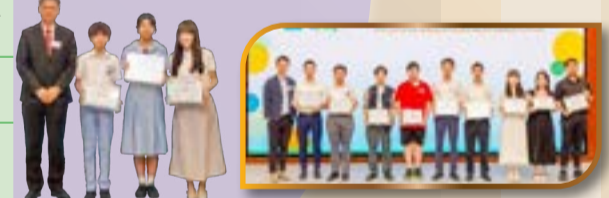
本校獲得 KS3 數學組別大獎 本校獲得 KS3 中文組別優異獎