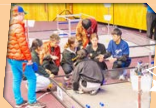
比賽過程中，同學展現出出色的溝通技巧和臨場應變能力。