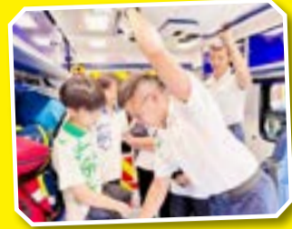
同學留心觀察急救員示範