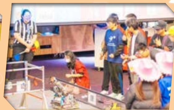
同學在比賽中竭盡所能，全程投入。