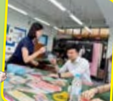
老師和家長一同享受製作捲紙的樂趣。