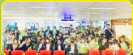
「選舉資訊中心」活動大合照

相信是次「選舉資訊中心」參觀活動不僅加強了學生對香港選舉的認識，還能培養學生成為有識見、負責任的公民。