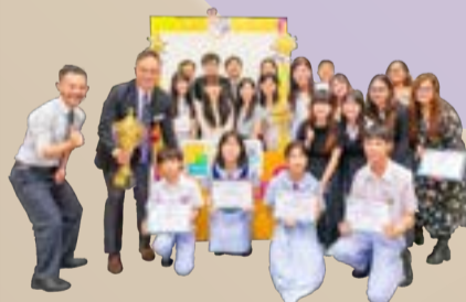
本校橫掃「混合式學習」計劃各科獎項