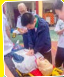
同學學習急救手勢