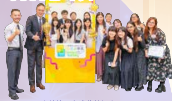
本校校長與獲獎教師合照

本校於香港中文大學和香港浸會大學聯合主辦的「賽馬會『混合式學習』計劃 - 2024/25 年度教學個案比賽及影片教材製作比賽」中表現傑出，成績斐然。該比賽旨在鼓勵教育工作者製作優質的「混合式學習」(Blended Learning) 教學個案及影片教材，並為業界提供展示和分享卓越教學成果的平台。