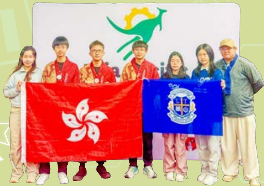
資優機械人隊隊員在賽事中表現出色。