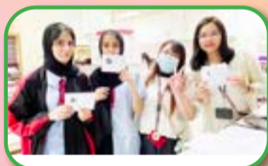
Song Dedication - spreading the message to save our Earth

The week started with a lively 'Music Broadcast', featuring our theme song, 'All Things Bright and Beautiful', and five songs for each form. In 'Song Appreciation' sessions, students analysed lyrics and explored the messages behind the music, enhancing their English skills while highlighting the importance of ecological balance.