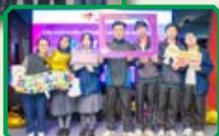
同學在參觀期間了解更多升學及就業的出路。