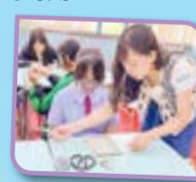
同學認真製作小布袋。

「中式繡花小袋刺繡工作坊」及「彩紗線梭織工作坊」邀請導師到校，教授同學製作精緻的小布袋。在活動過程中，同學不僅認識了傳統手工藝的文化，也親身體驗不同的針織手法，全神貫注製作出屬於自己的小布袋，享受平靜及療愈的時刻。