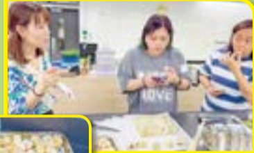
家長和老師一同投入製作雪花酥。