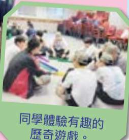
同學體驗有趣的 歷奇遊戲。