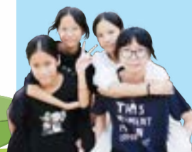
同學蓄勢待發 準備攀岩。

此次成長營不僅為同學們提供了突破自我的平台，更寄望能幫助他們挖掘潛能、發現自身優點，進一步培養責任感與團隊合作精神。