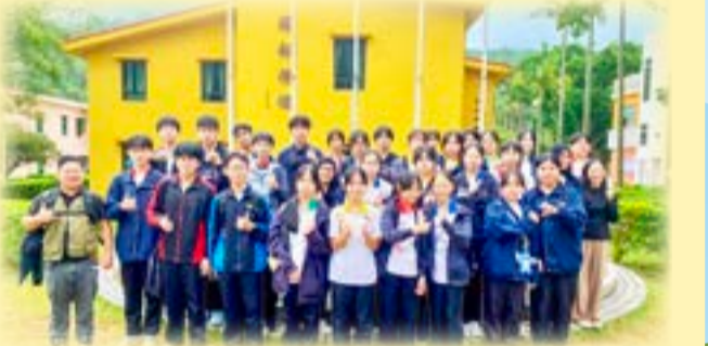
同學在營中獲益良多。