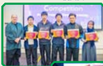
本校校園電視台成員獲短片創作大賽優異獎。