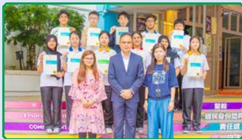
Congratulations to all our students for their remarkable efforts and success.

Every year, schools around Hong Kong participate in the renowned Hong Kong Schools Speech Festival, providing an opportunity for students to show their talent and a platform for them to experience public speaking. This prestigious event celebrates the art of eloquence, creativity, and expression, exposing students to different parts of life.