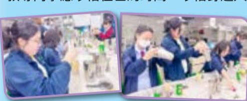
同學成功調製出可口消暑的無酒精飲品。

在「Mocktail 體驗班」中，導師教授同學調製出可口消暑、五彩繽紛的無酒精飲品。在活動過程中，同學能學會使用調製器皿、運用不同食材及飲品、裝飾等技巧，最後，調製出三杯不同口味的無酒精飲品。同學們積極投入參與，歡聲笑語一片，享受美好的午後時光。