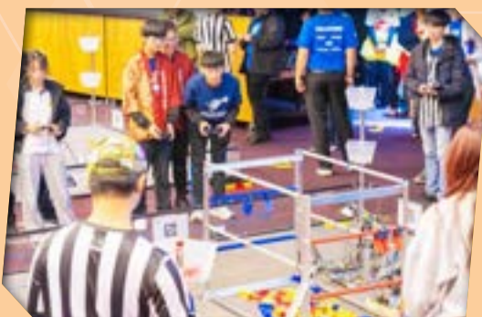
隊員沉著應對比賽，展現了卓越的編程及工程實力。