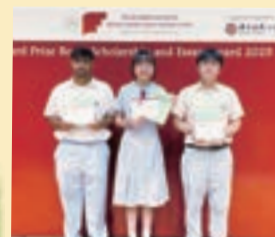
Their hard work, perseverance, and outstanding achievements have brought great pride to our school.