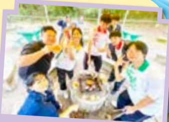
同學自主完成從生火、備料到烹飪的完整流程。

本次訓練營在同學們的熱情參與下圓滿落幕。活動雖已結束，但團隊合作與領導統御的種子已然播下。期盼所有學員能將所學內化於心、外化於行，在未來的校園生活與班級事務中，發揮領袖影響力，成為凝聚團隊、勇於承擔的中堅力量，共同譜寫更美好的校園篇章。