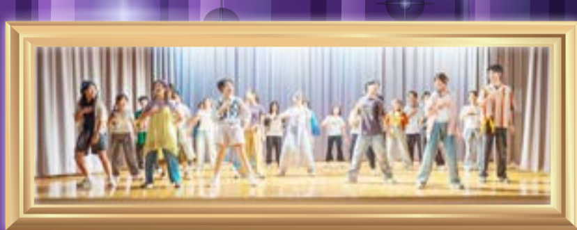
Magical moment - united in song and spirit