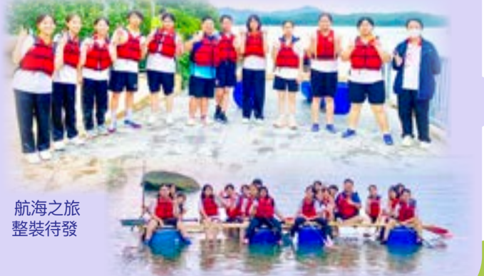
航海之旅 整裝待發