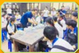
同學積極聆聽導師的介紹