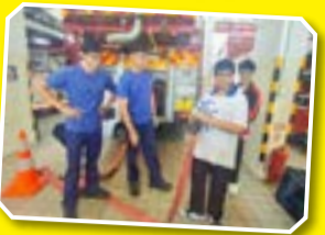
同學試用消防設備