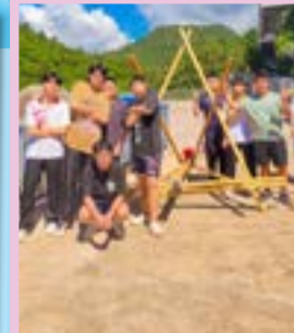
團結合作搭建羅馬炮架