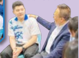
校長勉勵學生須繼續努力