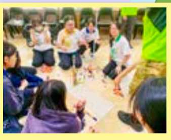
同學積極參與小組解難遊戲。