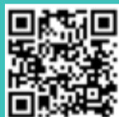
參賽影片《我們眼中的城大》