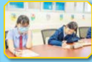
老師關心每一位學生的學習需要