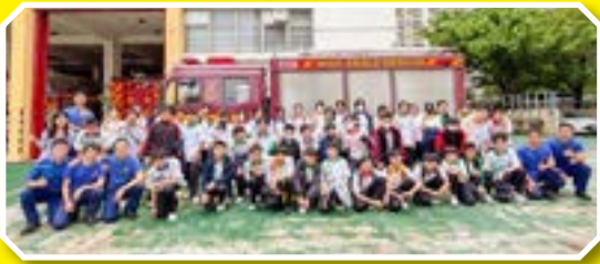
行業參觀活動大合照

中一及中二級的同學們透過參觀活動，不僅體驗到工作的實際情況，也得以增長見聞。希望各位同學能透過行業參觀反思自己的志趣，為將來的升就前路早作謀劃，日後可以一展所長。