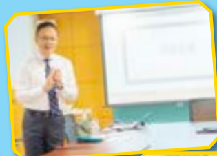
王校長致詞勉勵學生