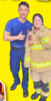
同學與消防員合照