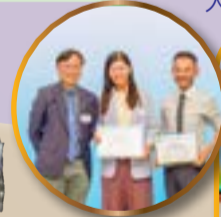
本校獲得 KS3 英文組別季軍