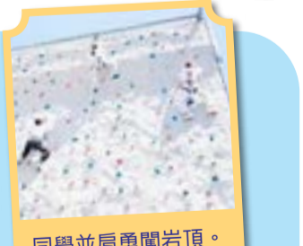
同學並肩勇闖巔頂。