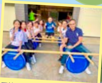
王校長勉勵同學勇於挑戰自我。

壓軸的「木筏建造與競賽」將活動氣氛推向高潮，各小組發揮創意與動手能力，紮製木筏，並在碧波上進行友誼賽，水花與笑聲交織，充分展現了同學們的活力與團隊智慧。透過是次訓練營，學生領袖們在實踐中學習了尊重、同理心、溝通、協作與堅持，獲益良多。我們期待他們將這份收穫帶回校園，成為更出色的領導者。