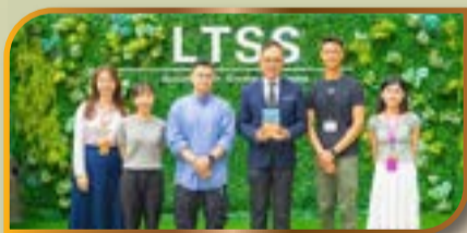
王校長與獲獎老師合照留念