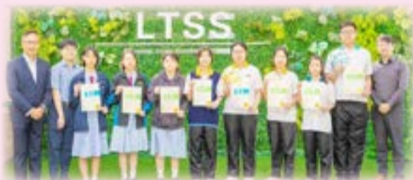
本校學生於第七十六屆香港學校朗誦節表現優秀。