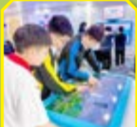
同學十分投入地參與中心的互動遊戲