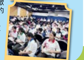
同學認真聆聽活動 講解。