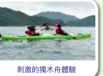
刺激的獨木舟體驗