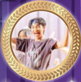
A dance of joy and passion