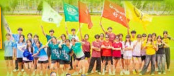
四社隊員士氣高昂