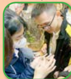
Biodiversity Exploration - reptiles in focus!