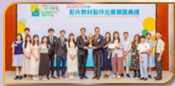
本校榮獲賽馬會「混合式學習」計劃學校大獎